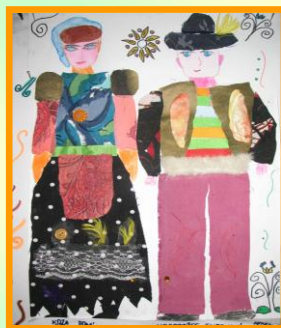
Bianka Bereníková, 4. A