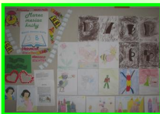
Práce žiakov z 3. B

Letí babka v koši, letí, oblaky sa nad ňou krútia. Z koša trčí jej len klobúk a metlička, metla z prútia.