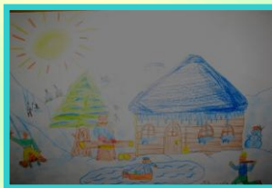
Dávid Dudášik, 4. B