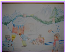
Pet'ko Kramarčík, 4. B