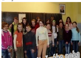
Talenty recitačného neba