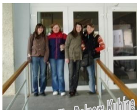
Baby na súťaži v Dolnom Kubíne