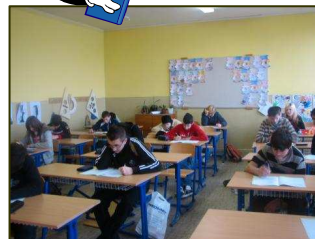
Minitor 9 – 6.2.2008