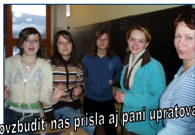
Povzbudit nás prišla aj pani upratovačka