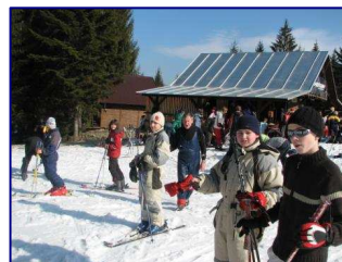
Lyžiarsky výcvik - Sihelné