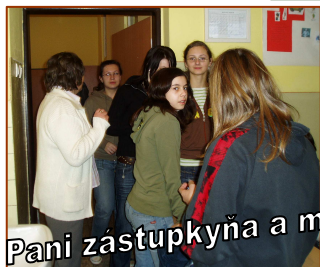
Pani zástupkyňa a my...