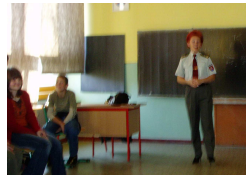
Beseda bola zaujímavá

Besedy sa zúčastnili žiaci 8. a 9. tried. Reč bola o trestno-právnej zodpovednosti. Beseda bola spestrená skutočným príbehom, ktorý sa týkal tejto témy.