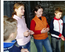
Šiestaci na krížku