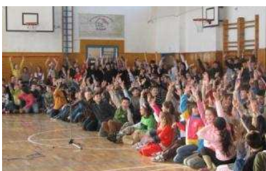
Telocvičňa pred Vianocami znela potleskom ...

S názormi žiakov v anketách sa nemusia stotožňovať členovia redakčnej rady Ilustrácie: Jaroslav