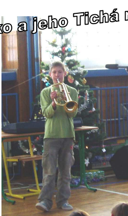
Ferko a jeho Tichá noc