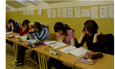
8. B pri práci

Na našej škole v jazykovej učebni máme vynovenú techniku. Nachádzajú sa tam slúchadlá. Celé to funguje tak, že na každej lavici sú dve slúchadlá a dva ovládacie prístroje. Cez slúchadlá sa žiaci môžu rozprávať s učiteľom, ale môžu si aj vypočuť nové učivo.